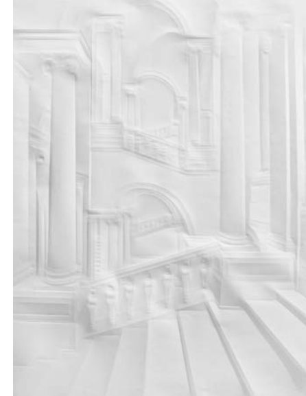
ohne Titel ( Berlin Stadtschloss Große Treppe ), 2010 Papier gefaltet, 100 × 75 cm Rene S. Spiegelberger Stiftung, Hamburg

LICHT UND SCHATTEN bringen an den reliefartigen Faltzeichnungen erst das jeweilige Bild zum Vorschein. Im richtigen Licht erschließen die gefalteten Oberflächen die Tiefen einer imaginären Architektur, in die der Betrachter sich begibt. Im Zwiellicht lösen sich diese flüchtigen Bilder aber wieder auf. Während die lichten Raumsequenzen mit ihren (neo)barocken Vertäfelungen, Zierleisten, Fenster- und Türdurchblicken, verwinkelten Fluren und Treppen an die atmosphärischen Interieurs des dänischen Malers Vilhelm Hammershøi erinnern, lassen Schuberts düstere Grafitzeichnungen und manche gesichtslose Skulptur an filmische Szenen von David Lynch denken.