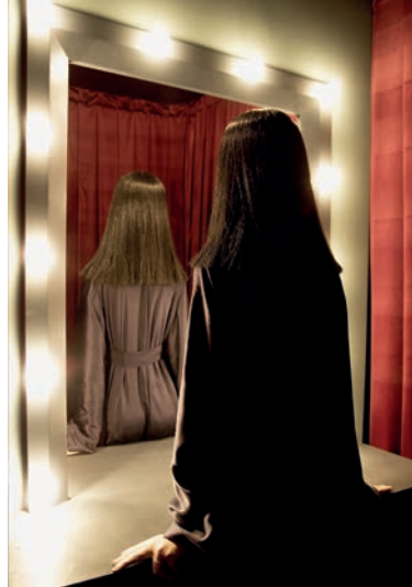
Die verbotene Reprobation, 2007 Mixed Media 220 × 150 × 275 cm Courtesy der Künstler Foto: Andrej Glusgold

Zur Ausstellung gestaltet der Künstler eine außergewöhnliche, vom Museumsverein Morsbroich e.V. aufgelegte Edition in Form zweier Hologramme. Kontakt, weitere Informationen und Vorbestellungen: claudia.leyendecker@museum-morsbroich.de