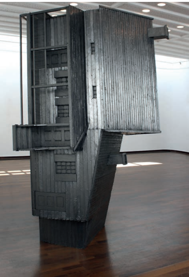
Das Haus, 2019 Mixed Media 285 × 125 × 153 cm