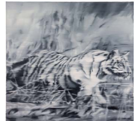
Gerhard Richter, Tiger , 1965 Fotoverwischung, 140 x 150 cm Museum Morsbroich, Leverkusen; © Gerhard Richter, 2016

Richter und Polke: Es entspinnt sich ein lockerer Dialog, der durch eine Auswahl von Werken Gerhard Richters aus der museumseigenen Sammlung ergänzt wird. Zahlreiche Drucke aus den Jahren 1965–1974 wurden ebenso früh für das Museum Morsbroich erworben wie Richters 1965 entstandenes Gemälde Tiger . Ein von Richter als Siebdruck Hotel Diana (1967) produziertes frühes »Selfie« zeigt Polke und Richter Bett an Bett im Billighotel. Die Selbstironie, mit der sie sich möglichen Anfängen eines Künstlerkults entziehen, spricht auch aus dem Gemeinschaftswerk Umwandlung (1968): Mit (heroischen oder magischen?) Kräften haben die beiden in den »5 Phasen« dieses Offsetdrucks ein Bergmassiv aufgelöst und in eine sphärische Kugel verwandelt.