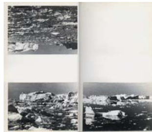
Gerhard Richter, EIS , 1981 Entwurf einer Doppelseite zu dem Künstlerbuch EIS Gerhard Richter Archiv, Staatliche Kunstsammlungen Dresden; © Gerhard Richter, 2016; Foto: Heinrich Mess, Köln