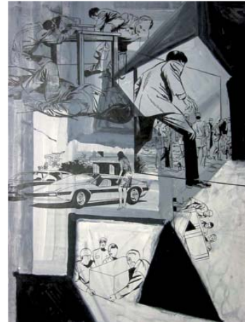
Sigmar Polke, ohne Titel , 2004 Gouache auf Papier, 200 x 150 cm Privatsammlung Rheinland; © The Estate of Sigmar Polke / VG Bild-Kunst, Bonn 2016