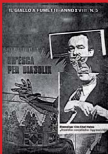
Sigmar Polke, Diabolik , 1979

Museum Morsbroich, Grafiktage 13. März – 28. August 2016