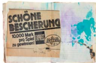
Sigmar Polke, ohne Titel ( Weihnachten 1985 ), 1985 Collage in Klebebuch, Tinte, 20,5 x 16,2 cm Privatsammlung; © The Estate of Sigmar Polke / VG Bild-Kunst, Bonn 2016