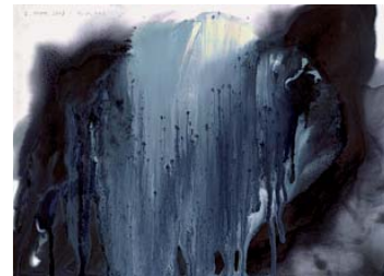
Gerhard Richter, November , 2008 54 digitale Tintenstrahldrucke, gerahmt, verglast, je 21 x 29,7 cm (Blatt) Gerhard Richter Archiv, Staatliche Kunstsammlungen Dresden; © Gerhard Richter, 2016

Gingen die beiden Künstler nach 1970 auch verschiedene Wege, so gibt es in ihrem Schaffen doch wiederholt Berührungspunkte, wie ein Vergleich von Polkes zufallssteuerten Klecksografien in einem Stenogramm -Heft (1985) mit Richters Edition November (2008) zeigt. Beide Künstler lassen die farbige Tinte durch das Papier dringen und entwickeln aus den auf den Rückseiten entstandenen Farbverläufen eigenständige Bilder. Zu Richters Künstlerbuch EIS (1972), das Fotografien von dessen Grönlandreise zeigt, werden die gemalten Umschlagentwürfe präsentiert.