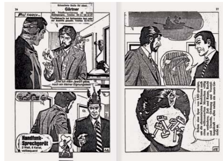
Sigmar Polke, Diabolik , 1979 Collage auf den Seiten eines Comic-Hefts, fotokopiert, 19,5 x 12,5 cm Privatsammlung; © The Estate of Sigmar Polke / VG Bild-Kunst, Bonn 2016

Polke und Richter: Anfang der 1960er Jahre kannten sie sich so gut, dass sie »nicht mehr miteinander pokern konnten«. Für ihre 50 Jahre zurückliegende Gemeinschaftsausstellung in der Galerie h 1966 gestalteten sie ein Künstlerbuch, das Zitate aus trivialen Hefromanen mit eigenen Texten und Fotografien verband – eine Collage mit viel Freude am »Quatsch machen« (Richter). Zu den dort publizierten, inszenierten Aufnahmen der beiden Künstlerfreunde gehört das berühmte Bild in der Badewanne.