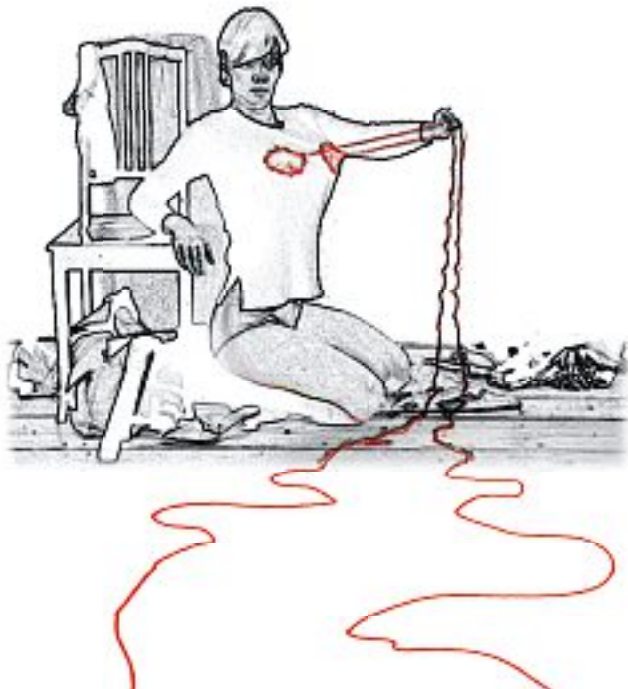
Lessons I Learned from Rocky I to Rocky III, 2003 Videostill