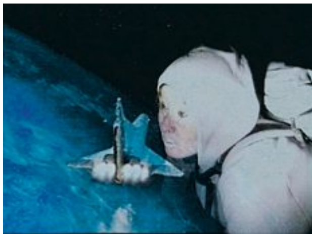
Flug zum Mond , 1998 Musikvideo 1/6, Videostill